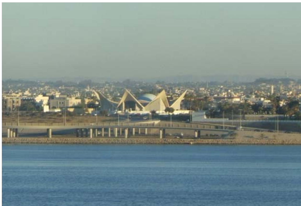
Il planetario di Tripoli