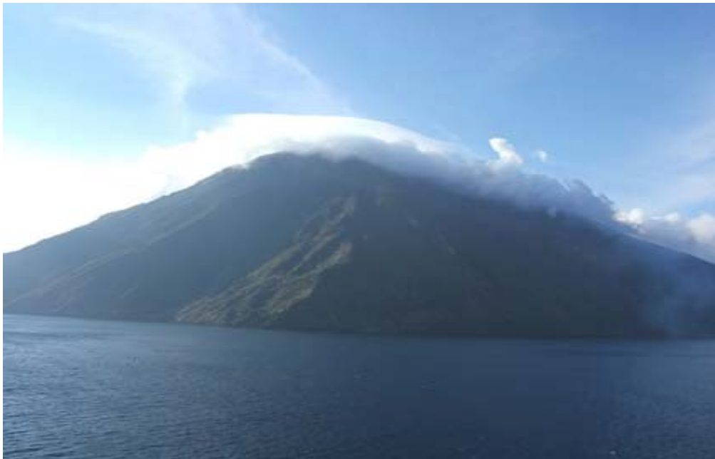
L'isola di Stromboli avvolta dalle nubi

Nel pomeriggio giungiamo alle isole Eolie, con l'isola di Stromboli avvolta dalle nubi, un'immagine molto suggestiva che colpisce un po' tutti tanto che molti sono i click delle macchine fotografiche, lo spettacolo che ci riserva lo stretto di Messina al tramonto è ancora più bello: le nubi in cielo e i colori del tramonto rosati danno una suggestione al paesaggio molto particolare, quasi fosse un dipinto. Quindi raggiungiamo il ristorante "Michelangelo", stasera c'è il galà di benvenuto, questo ristorante dedicato alla nave da crociera "Michelangelo" (un modello è esposto all'ingresso del ristorante) è grandissimo e molto accogliente; il cibo è ottimo, anche se le quantità sono mini e le portate sono servite lentamente, tanto che finiamo verso le 23.30.