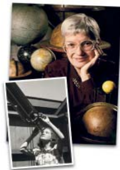
L’astronoma Vera Cooper Rubin

Oggi, le donne che lavorano in “team” presso i maggiori Istituti di ricerca di livello mondiale sono davvero numerose e ben preparate; ed anche se i loro nomi sono spesso sconosciuti ai più, il loro contributo alla scienza ed alle tecnologie applicate sono indubbiamente fondamentali. Fra le figure più famose apparse sulla scena nel corso del Novecento, vogliamo ricordare l’astronoma statunitense Vera Cooper Rubin, nata a Philadelphia nel 1928. Nel corso della sua carriera si è occupata principalmente degli studi sulla struttura dell’Universo, dimostrando perfino l’inesattezza di alcune teorie che sembravano assolutamente inattaccabili (cosa che in realtà avviene per qualsiasi teoria, la quale risulta valida sino a quando un’altra non arriva a confutarla).