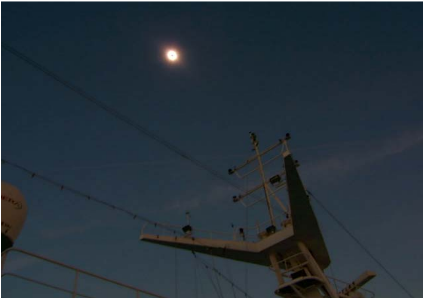
La totalità dalla nave da crociera

Di questa splendida avventura ci è rimasta una gran voglia: quella di correre verso la prossima eclissi. Il 2009 e la Cina, con i suoi 6 minuti totalità, non sono poi così lontani...!