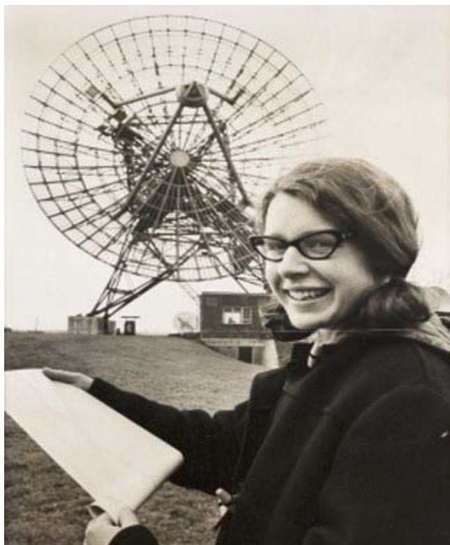
La giovane astronoma Jocelyn Bell nel 1968

Nel frattempo, al di qua dell'oceano e precisamente in Inghilterra, Jocelyn Bell, "Lady Pulsar", classe 1943, compiva alcune interessanti scoperte. Mentre era ancora studentessa presso l'Università di Cambridge, la Bell, durante la lavorazione per la costruzione di un radiotelescopio, scoprì casualmente una sorgente di impulsi radio provenienti dallo spazio che si succedevano ad intervalli di tempo regolari. Successive ricerche in questa direzione portarono all'identificazione di altre sorgenti simili che vennero appunto chiamate "pulsar" e che confermarono l'esistenza delle stelle di neutroni, corpi celesti piccoli e densi che ruotano a velocità impressionante intorno al proprio asse.