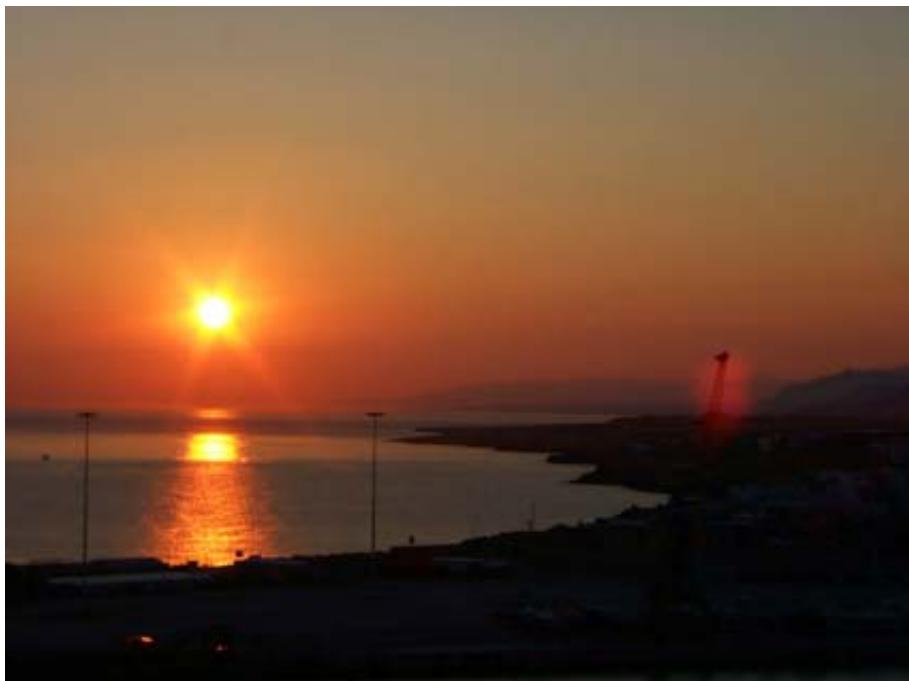
Alba su Heraklion (Creta)

L'eclissi totale di Sole è stato l'evento astronomico centrale della nostra stagione. Preparata da mesi, ha coinvolto interamente il nostro circolo (come vedremo più avanti) che mai si era spinto, in gruppo, così "lontano da casa". E' stata anche la nostra seconda spedizione ufficiale all'estero, dopo quella del 1999 in Austria e come questa ha fortunatamente goduto di tempo clemente e risultati assai soddisfacenti. Siamo stati felici testimoni di quattro emozionanti ed entusiasmanti minuti, nella magnifica cornice di una nave da crociera sul Mediterraneo, durante i quali il Sole e la Luna hanno rinnovato quello spettacolo incredibile che si chiama eclissi totale. Purtroppo sono stati anche minuti che al sottoscritto, nell'insolita veste di astrofotografo, sono apparsi assai brevi, ancor più di quelli dell'esperienza austriaca. Mi rimangono però le diapositive, perfettamente riuscite, a testimoniare l'eccezionale evento ed il ricordo di una bella avventura di gruppo. Soprattutto quest'aspetto è la parte che più mi piace evidenziare. Una settimana di vacanza vissuta insieme e preparata giorno per giorno con agli altri membri dell'associazione. Infatti, anche chi non è potuto venire in