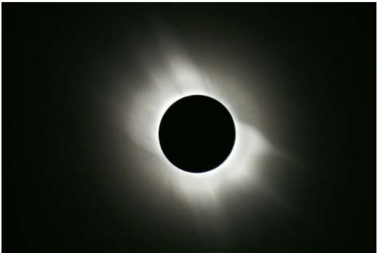
La corona visibile durante la totalità

Dopo cena ci riuniamo per vedere le foto e i filmati dell'eclisse veramente ottimi ottenuti da alcuni di noi. Ormai è deciso vogliamo vedere un'altra eclisse totale di Sole e la prossima potrebbe essere quella del 22 luglio 2009 in Cina, la totalità durerà ben 6 minuti !